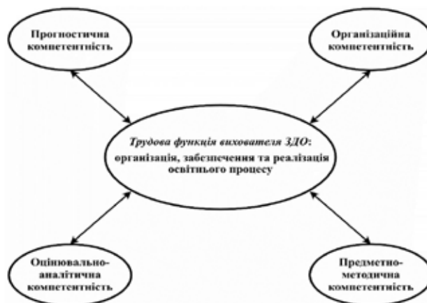
Рис. 2. Компетентнісне забезпечення успішної реалізації провідної трудової функції вихователя ЗДО

предметно-методична та організаційна. Саме організаційна компетентність визначена як здатність організовувати ігрову (провідну) й інші види дитячої діяльності та підтримувати види діяльності, ініційовані дитиною, що власне й забезпечує реалізацію вихователем однієї із найважливіших трудових функцій – організацію, забезпечення та реалізацію освітнього процесу [Професійний стандарт].