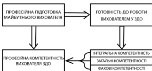
Рис. 1. Професійна компетентність майбутнього вихователя ЗДО як результат професійної підготовки

У Професійному стандарті „Вихователь закладу дошкільної освіти” провідною трудовою функцією вихователя закладу дошкільної освіти визначено організацію, забезпечення та реалізацію освітнього процесу, орієнтованого на формування компетентностей дитини раннього та дошкільного віку. Успішну реалізацію цієї функції забезпечує низка професійних компетентностей особистості вихователя, як-от: прогностична, оцінювально-аналітична,