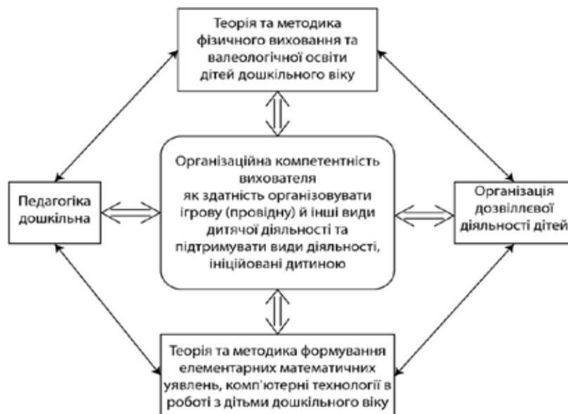
Рис. 4. Сформованість організаційної компетентності вихователя ЗДО як результат системного вивчення освітніх компонентів

кового освітнього компоненту «Організація дозвілєвої діяльності дітей» (тема «Ігрова діяльність дітей») студенти поглиблюють теоретичні знання, одержані під час засвоєння нормативного освітнього компоненту «Педагогіки дошкільної»: поняття ігрової діяльності, гри, види гри, вимоги до гри, правила гри тощо. Здобувачі освіти вчаться на належному теоретичному рівні робити узагальнення, порівняння, систематизацію різних підходів учених до тлумачення гри та сутності ігрової діяльності; пропонують авторські визначення гри та ігрової діяльності дитини, визначають специфіку ігрової діяльності дітей різного віку (від раннього до переддошкільного).