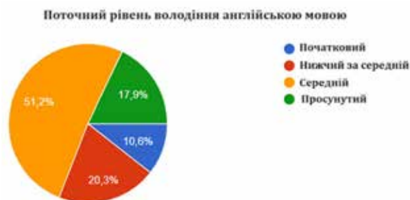
Рис. 2. Поточний рівень володіння англійською мовою учасників онлайн-опитування

шокурсників, що дало змогу глибше зрозуміти розмаїття студентської спільноти та підкреслити важливість індивідуальних мотиваційних стратегій. Рівні володіння мовою були класифіковані наступним чином: