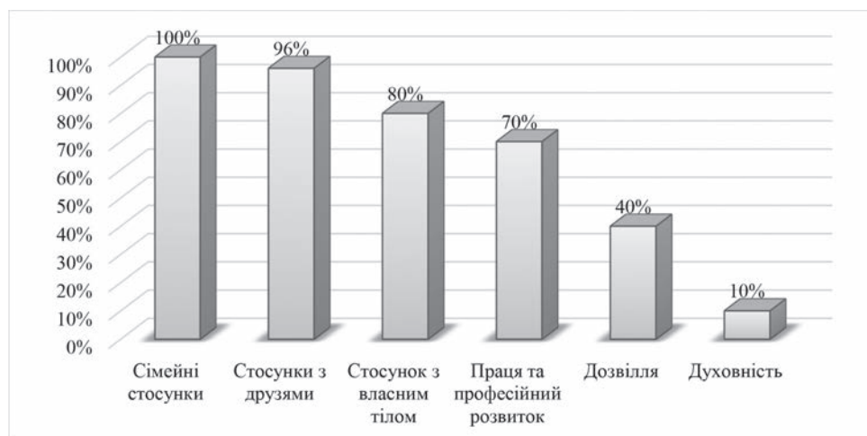
Рис 2. Відсоткове співвідношення актуальних сфер життя майбутніх педагогів

У результаті проведеного тренінгового заняття у студентів були сформовані знання стосовно поняття цінностей і їх ролі в житті особистості, збільшено усвідомленість респондентів стосовно власної ціннісної структури особистості, удосконалено навички формування цілей конгруентних власним цінностям. Побудова цілей, в основі яких лежать власні цінності, сприяють зосередженню зусиль та енергії, є джерелом мотивації і рушійною силою, особливо при зіткненні із труднощами або неочікуваними ситуаціями, які є частим явищем у педагогічній практиці. Перспективу майбутніх досліджень вбачаємо у моніторингу стану виконання цілей і зміни якості життя як наслідку реалізації досліджуваного процесу.